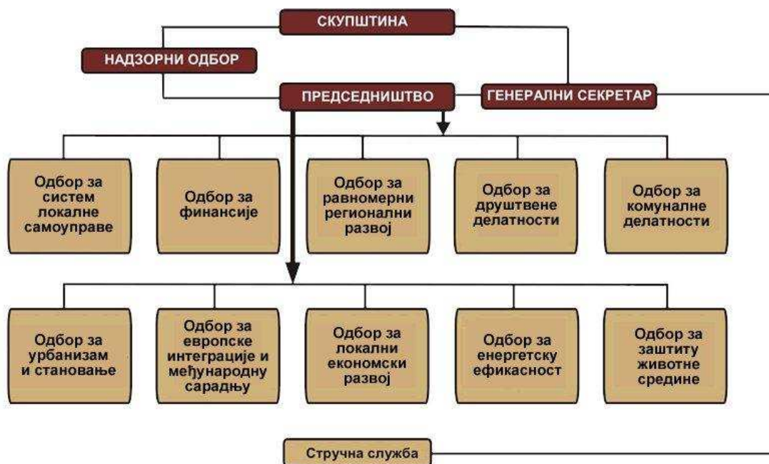
Слика 1: Политичка структура СКГО

Највиши орган СКГО је Скупштина , коју чине представници свих градова и општина Србије. Скупштина заседа најмање једном годишње и доноси најважније одлуке од значаја за рад СКГО. Скупштина бира органе СКГО и дефинише стратешке циљеве и приоритетне задатке организације. Председништво је извршни орган који руководи радом СКГО у периоду између два заседања Скупштине. Оно се састоји од 23 чланова – представника градова и општина изабраних на Скупштини и генералног секретара СКГО, који је члан Председништва по положају. СКГО има 10 ресорних одбора који покривају различите области од значаја за локалну самоуправу – систем локалне самоуправе, финансије, заштита животне средине, урбанизам, комуналне делатности, енергетска ефикасност, друштвене делатности, локални економски развој, регионални развој, међународна сарадња и ЕУ интеграције. Одбори разматрају проблеме у областима из своје надлежности, дају мишљења и упућују предлоге са циљем унапређења законског оквира и стања у областима за које су задужени.