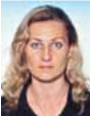
Piše: Mr Slađana Sredojević

Ako imamo u vidu da je obezbeđivanje sredstava kredita jedan od aksioma bankarskog poslovanja koji postoji oduvek i svuda, uključujući i Srbiju, situacija nezadovoljene tražnje postojaći sve dok su lokalne samouprave u nemogućnosti da garantuju za otplatu kredita svojim prihodima i imovinom