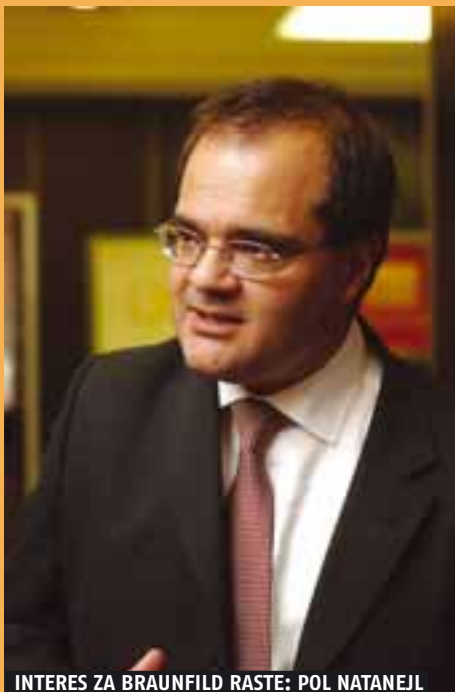
INTERES ZA BRAUNFILD RASTE: POL NATANEJL

CABERNET MREŽA: Počasni gost konferencije bio je profesor Pol Natanejl iz Velike Britanije, predsedavajući evropske mreže eksperata angažovanih u revitalizaciji braunfilda – CABERNET. Prema rečima profesora sa Notingemskog univerziteta, ova mreža postoji od 2002. godine. "Sedište je u Notingemu i njom upravljaju četvorica direktora: dvojica iz