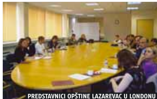
PREDSTAVNICI OPŠTINE LAZAREVAC U LONDONU

Tokom posete predstavnici nagrađenih opština Srbije imali su priliku da posete opštine Sadek i Lester, i upoznaju se sa organizacionom strukturom i radom opštinskih uprava. Jedna od specifičnosti strukture opština u Velikoj Britaniji je ta što svaka opština poseduje Komisiju za ispitivanje odluka koje opština donosi, tj. da li je njihovo donošenje svrsishodno i u skladu sa potrebama građana. S obzirom na veliki broj ljudi različitih nacionalnosti koje