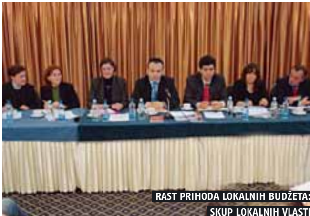
RAST PRIHODA LOKALNIH BUDŽETA: SKUP LOKALNIH VLASTI

po mišljenju Vasiljevića, tokom naredna dva meseca bi mogao da se očekuje završetak procedure javne nabavke, nakon čega bi krenulo sukcesivno opremanje gradova i opština sa informacionim sistemom i pratećom opremom neophodnom za njegovo funkcionisanje. Čitav projekat i implementacija sistema lokalne poreske administracije zamišljeni su kao jedan od koraka u pravcu elektronske uprave na nivou Republike Srbije i ovo ministarstvo će i dalje