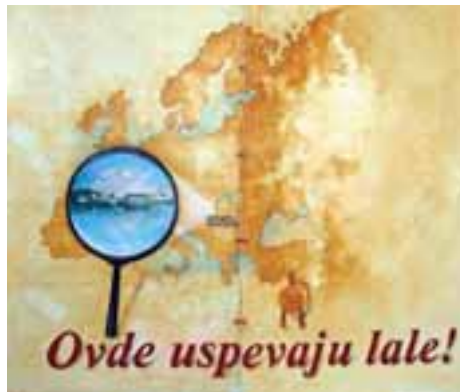
LOGOTIPI: NOVI BEČEJ, IRIG I SREMSKI KARLOVCI

LEGITIMITET DAJU GRAĐANI: Kao jedna od aktivnosti na projektu u prethodnoj fazi izdvaja se i izbor za viziju, slogan i logo strategije održivog razvoja lokalne zajednice, elemente kojima strategija dobija svoj prepoznatljiv vizuelni identitet. Ova aktivnost značajna je po