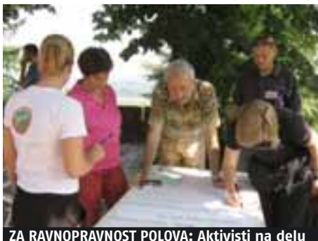
ZA RAVNOPRAVNOST POLOVA: Aktivisti na delu

stručna mišljenja iz oblasti rodne ravnopravnosti, kako vladinim institucijama tako i nevladinim organizacijama. Jedan od dobrih primera prakse kako se ostvaruje ova saradnja na podizanju kapaciteta različitih institucija u oblasti rodne ravnopravnosti, jeste nedavno ostvaren kontakt sa Stalnom konferencijom gradova i opština na formulisanju rodno senzitivnih odredbi u okviru dokumenta "Neposredno učešće građana u javnom životu na lokalnom nivou", koji je izradila Radna grupa za jačanje građanskog učešća SKGO-a.