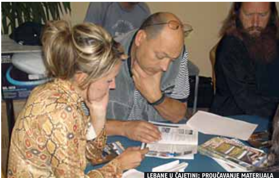
LEBANE U ČAJETINI: PROUČAVANJE MATERIJALA

Da li u Srbiji ima dovoljno opština sa dobrom praksom i umeju li da prenesu znanja