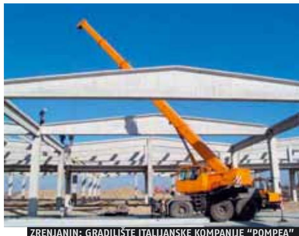
ZRENJANIN: GRADILIŠTE ITALIJANSKE KOMPA NIJE "POMPEA"

Jedna od pomenute tri grinfield investicije u Zrenjaninu sa liste SIEPE jeste i gradnja pogona italijanske kompanije Fulgar, velikog evropskog proizvođača sintetičkih vlakana za tekstilnu industriju. Ova kompanija otvorila je nedavno gradilište u novoformiranoj industrijskoj zoni "Severozapad", gde će podići proizvodne pogone na površini od oko šest hektara. U početnoj fazi investicije Fulgar će izgraditi 13.000 metara kvadratnih pokrivenih proizvodnih hala, uložiti oko 8,5 miliona evra i zaposliti više od 300 radnika. Početak proizvodnje očekuje se već u septembru ove godine. Ambicije ove kompanije jesu proširenje proizvodnih pogona u konačnoj fazi do 36.000 metara kvadratnih i ulaganja do 20 miliona evra. Zanimljivo je da je na odluku rukovodstva kompanije Fulgar da se investi-