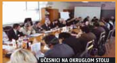
UČESNICI NA OKRUGLOM STOLU

Petog decembra 2006. godine na okruglom stolu o transformaciji javnih komunalnih preduzeća u Srbiji održanom u Beogradu okupilo se 45 predstavnika različitih ministarstava, jedinica lokalnih samouprava, javnih komunalnih preduzeća i međunarodnih finansijskih institucija. Učinkavost javnih komunalnih preduzeća za vodosnabdevanje, daljinsko grejanje i upravljanje čvrstim komunalnim otpadom je neadekvatan i rezultira u vidu visokih gubitaka vode (do 40–50 odsto), niskom energetsom efikasnošću i lošim upravljanjem otpadom. Javna komunalna preduzeća ne mogu priuštiti neophodne investicije zbog niskih tarifa i nedovoljne