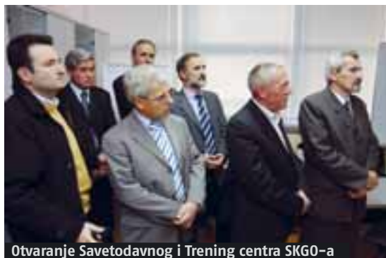
Otvaranje Savetodavnog i Trening centra SKGO-a

U ovom trenutku Trening centar može ponuditi jednodnevnu ili višednevnu obuku na više tema koje su od koristi opštinama u Srbiji: debatovanje, uloga opštinske skupštine u podršci strateškom procesu i lokalnom ekonomskom razvoju, uloga i odgovornost odbornika, usavršavanje veština javnog govora, komunikacija sa građanima i javni nastup, upravljanje projektnim ciklusom, upravljanje ljudskim resursima, uloga saveta za međunarodne odnose u upravljanju etničkom različitosti, priprema projekata u skladu sa EU procedurama, trening za realizaciju projekata, strateški plan socijalne zaštite, opštinski forum o strategiji održivog razvoja, instrumenti za planiranje i upravljanje komunalnim otpadom, međusobna procena kapaciteta lokalnih samouprava.