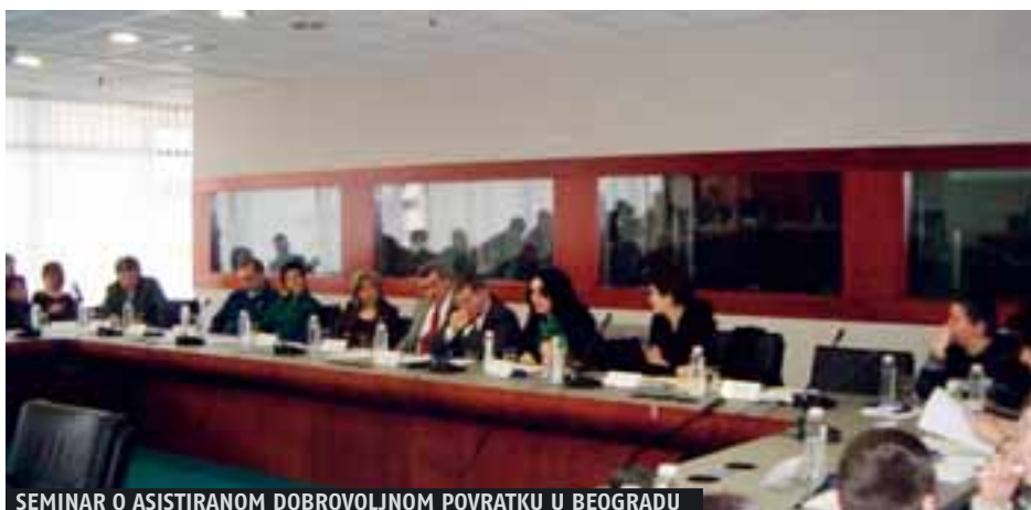
SEMINAR O ASISTIRANOM DOBROVOLJNOM POVRAKU U BEOGRADU