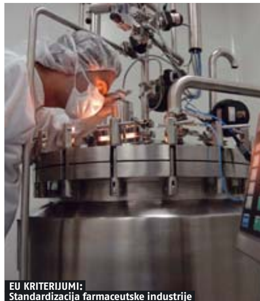
EU KRITERIJUMI: Standardizacija farmaceutske industrije

VEZA SA EU ZAKONODAVSTVOM: Nacionalni investicioni plan za integraciju Republike Srbije sadrži sve obaveze Srbije iz Sporazuma o stabilizaciji i pridruživanju i omogućava jedinstveno praćenje njihovog sprovođenja. Po prvi put povezuje evropsko zakonodavstvo i domaći pravni poredak tako da je moguće u svakom trenutku pratiti tempo i kvalitet usklađivanja doma-