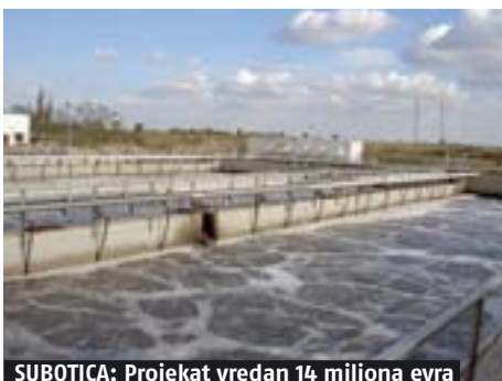
SUBOTICA: Projekat vredan 14 miliona evra

“Srbija je u pretpristupnoj fazi i želimo da bude spremna za pristupnu fazu. Usvajanje nacionalne strategije za upravljanje čvrstim otpadom je dobar pokazatelj smera u kojem ide Vlada. Bilo bi dobro da takve inicijative postoje i u drugim oblastima, i mi ohrabrujemo Vladu Srbije da nastavi u tom pravcu. Paralelno, srpska vlada mora da radi na pripremama za finansiranje, odnosno za pretpristupne IPA fondove”, kaže Kok van Šoten, vođa MISP tima.