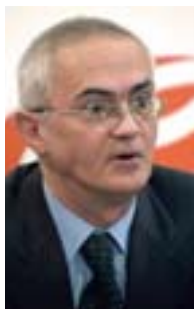
Piše: Rodoljub Šabić

Veliki je broj opština koje ne izvršavaju čak ni formalne obaveze po zakonu (objavljivanje Informatora o radu i dostavljanje Godišnjeg izveštaja o primeni zakona povereniku za informacije)