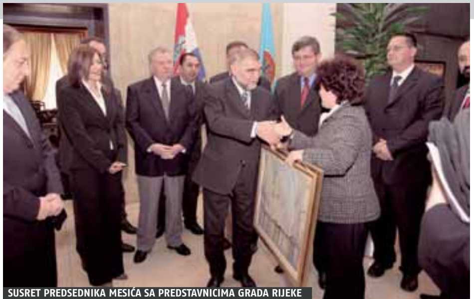
SUSRET PREDSEDNIKA MESIĆA SA PREDSTAVNICIMA GRADA RIJEKE

Neke od osnovnih zamjerki odnose se na: nedostatak političkih, administrativnih i budžetskih mjera nužnih za održiv povratak i reintegraciju povratnika (prema podacima Srpskog demokratskog foruma iz Zagreba, oko 140 mjesta na povratničkim područjima u potpunosti ili djelomično nema čak ni struju), niz